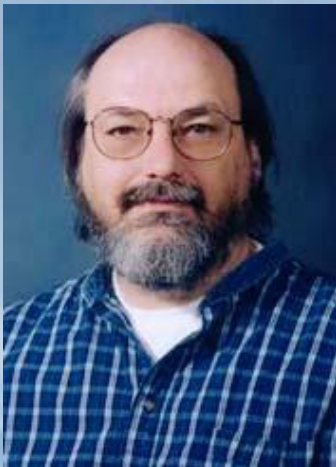
Ken Thompson - o criador do UNIX