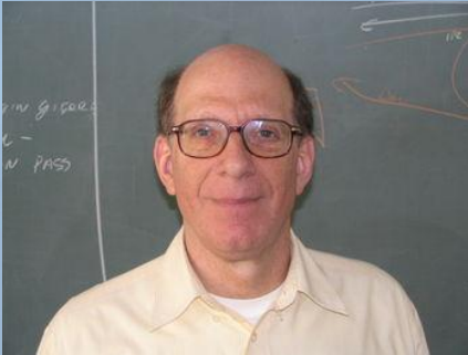
Andrew Stuart Tanenbaum

O Minix é um sistema operacional Unix-like (semelhante ao UNIX), gratuito e com o código fonte disponível.