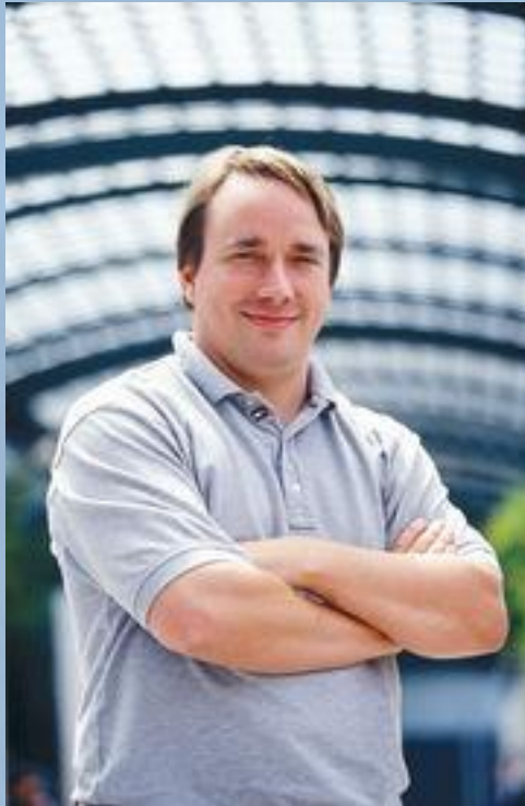
Linus Torvalds, criador e principal mantenedor do Kernel Linux.